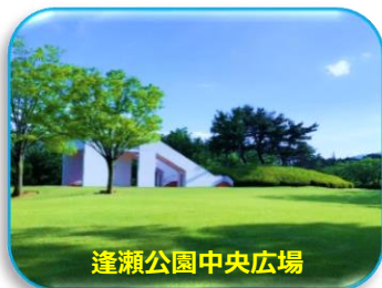
逢瀬公園中央広場